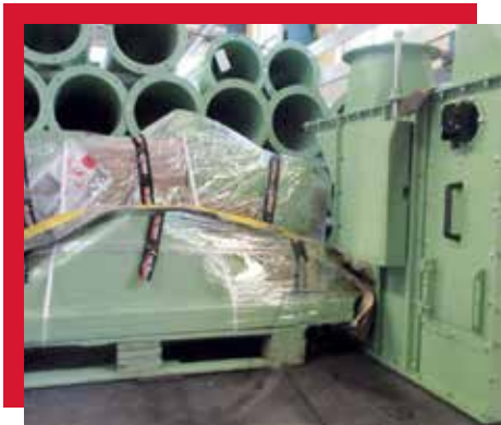
Die Anlage wird für den Transport vorbereitet. Die Anlagenteile sind bis zu 10 Tonnen schwer.