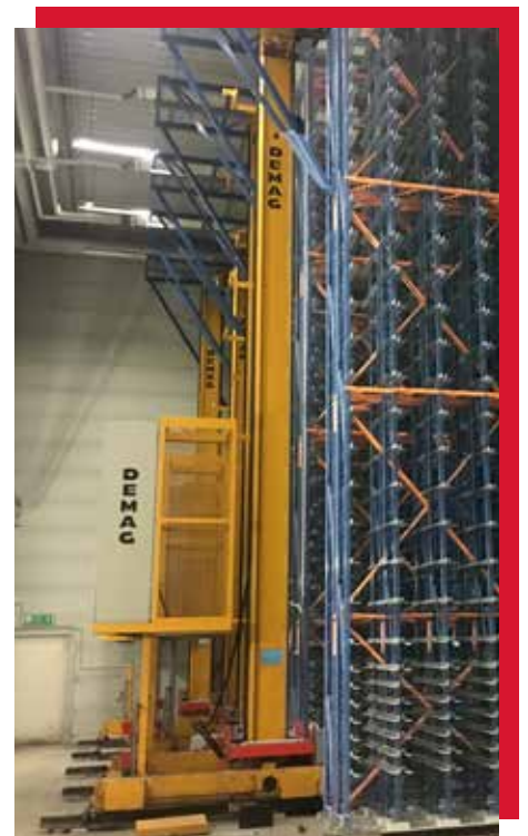
Der fachgerechte Abbau des Hochregallagers erfordert einige Planungsarbeit, um die bis zu 9 Meter hohen Anlagen innerhalb kurzer Zeit demontieren zu können.

Im Durchschnitt waren dort 15 Mitarbeiter von September bis Ende November im Einsatz. Neben der elektrotechnischen Komponente war die zu bewältigende Masse hoch. „Wir haben dort täglich einen LKW Material abtransportiert“, erklärt Frank Tönjes. Allein 10.000 Kunststoffbehälter mussten entsorgt werden. Dabei war vor allem eines knapp: die Zeit. Am Ende konnte die Halle vollständig entkernt und termingerecht übergeben werden.